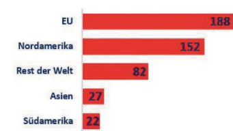
Grafik 3: Verteilung der 471 Transaktionen der strategischen Investoren der Süß- und Backwarenbranche von Q1 2018 bis Q3 2021 nach Regionen (global)